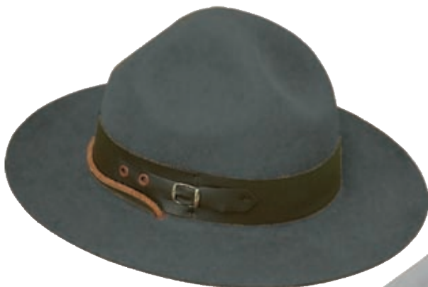
PFADFINDERINNENHUT Farbe(n): dunkelgrau Kopfumfang : 53-61 cm Preis: Euro 44,- Art.Nr: 201