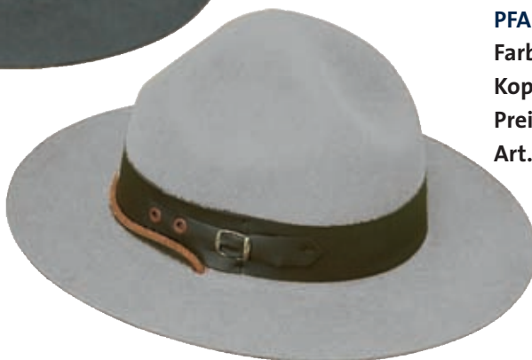
PFADFINDERINNENHUT Farbe(n): hellgrau Kopfumfang : 53-57 cm Preis: Euro 32,- Art.Nr: S200