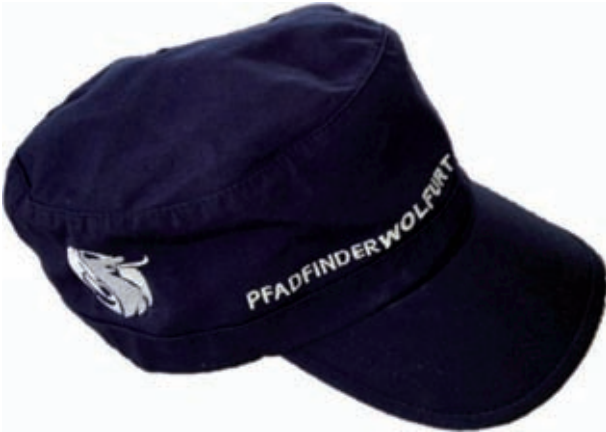
CAP PFADI WOLFURT „MADE WITH RESPECT“ Farbe: Marine Größen: ONE SIZE Preis: Euro 8,- Art.Nr: CAPWOL